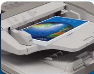
Alimentateur de documents

Vous pouvez accéder directement aux fonctions qui facilitent votre travail, depuis l'appareil imageRUNNER ADVANCE ou votre poste de travail. Le bureau de l'imageRUNNER ADVANCE présente une interface claire et complète qui transforme votre ordinateur en un poste de commande central. Vous pouvez désormais exécuter des tâches de flux de travaux associées à des documents personnels comme l'archivage, la fusion et la diffusion, directement depuis votre poste de travail avec la simplicité du « glisser-déplacer ». Vous pouvez aussi lancer facilement des recherches de documents et même surveiller l'état de vos travaux à partir de n'importe quel emplacement sur le réseau.