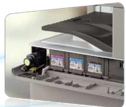
Bouteilles de toner

Les modèles imageRUNNER ADVANCE de la série C5000 assurent la productivité continue que recherche votre entreprise. Des avis d'état vous permettent de maintenir une longueur d'avance, et le papier et le toner peuvent même être remplacés à la volée. De plus, si le bon format de papier ou le bon support n'est pas disponible pour un travail, le système peut commencer à traiter sans délai le travail suivant en vue de maximiser le temps de fonctionnement.