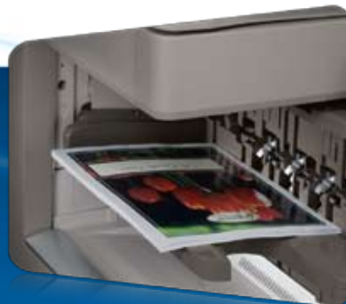
Module de finition interne