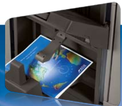
Module de finition de livrets