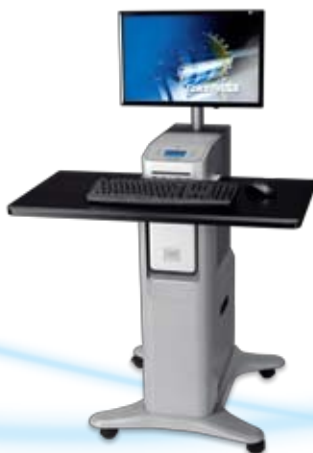
Contrôleur d'impression ColorPASS GX300 avec interface et support intégrés A1

Améliorez la productivité d'impression dans les environnements multi-utilisateurs où l'on fait grand usage de la couleur grâce aux contrôleurs d'impression imagePASS et ColorPASS* de Canon. Vous profiterez d'un flux de travaux efficace et d'une impression remarquable avec des outils évolués de gestion des couleurs et des travaux.