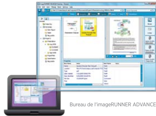
Bureau de l'imageRUNNER ADVANCE