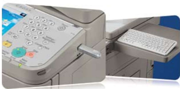
Support à mémoire USB

Les modèles imageRUNNER ADVANCE de la série C5000 sont conçus pour faciliter votre travail. Vous pouvez maintenant numériser des documents vers une clé USB ou les imprimer à partir de celle-ci. Augmentez vos options de connectivité pour y inclure un support à mémoire comme une carte SD ou CompactFlash*. Un clavier offert en option peut être branché à l'appareil pour faciliter la saisie des données.