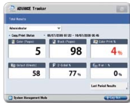
Écran de l'outil de suivi de l'imageRUNNER ADVANCE au panneau de commande

Il est plus important que jamais de réaliser des économies. Grâce à l'outil de suivi* de l'imageRUNNER ADVANCE de Canon, vous pouvez désormais identifier, évaluer et gérer les coûts d'impression. Visualisez l'utilisation des appareils, analysez la sortie de documents couleur ou encouragez l'impression recto verso directement depuis votre poste de travail. Vous pouvez également attribuer des coûts par service, projet ou client. Avec la capacité de surveiller plusieurs appareils en réseau et de recevoir des rapports automatisés par courriel, vous demeurez en plein contrôle de vos résultats.